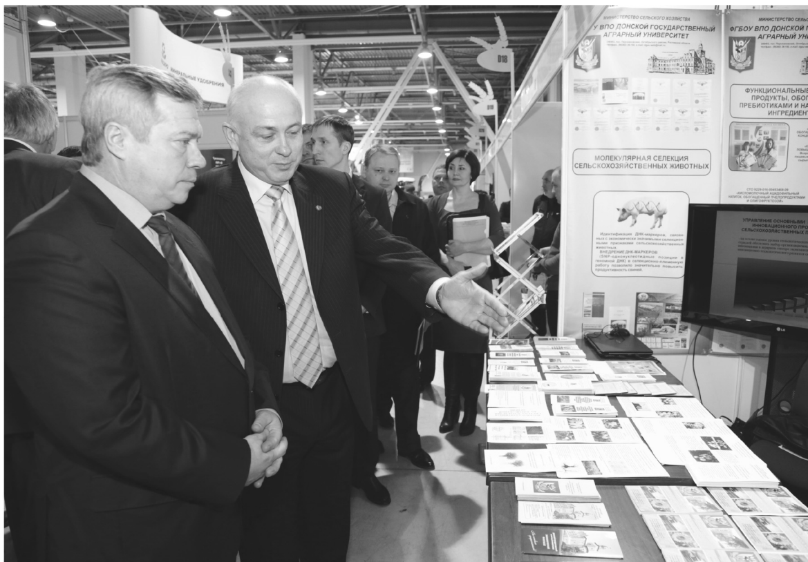
● Студенты уже предлагают свои исследования донскому АПК

К делу подготовки кадров готов подключиться и агробизнес, но пока это единичные